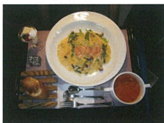
小松菜とホタテのパスタ

小松菜、水菜、サラダ菜など、 まだ種類は少ないですが、 季節ごとの色々な無農薬野菜を 使ったメニューをご提供して いきたいと思っております。